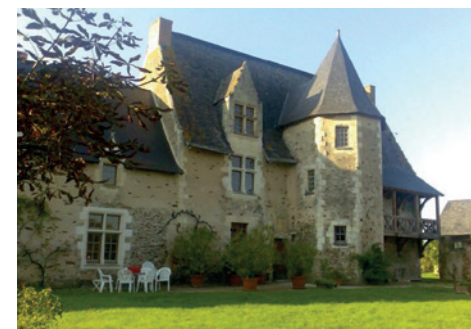
Manoir de Margot

Samedi et dimanche // 10h à 18h ● Visite libre ● Gratuit