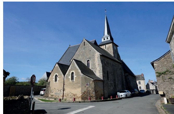
Église Saint-Martin de Vertou - XII e siècle (Chenillé-Champteussé, Champteussé-sur-Baconne)