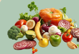
Fruits et légumes

Tous les déchets alimentaires solides de préparation et de reste de repas sont à déposer dans votre bac !