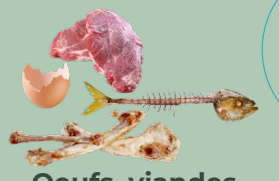
Oeufs, viandes et poissons

Pour le succès de l'opération, le respect des consignes de tri est impératif. Les biodéchets compostés iront enrichir des terres agricoles. La présence d'indésirables dans les biodéchets pourrait remettre en question le service.