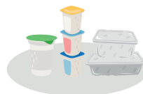
Tous les emballages plastiques