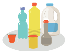
Bouteilles et flacons plastiques