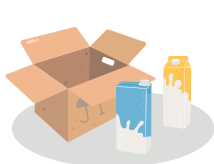
Cartons et briques alimentaires