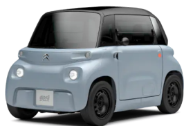
Voiture sans permis thermique