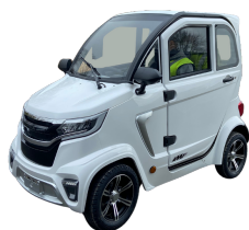
Voiture sans permis électrique