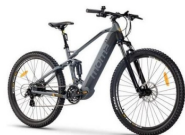
VAE (Vélo à assistance électrique)