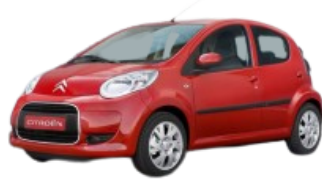
Voiture thermique permis B