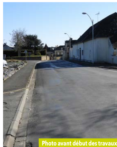
Photo avant début des travaux

Prochainement auront lieu les travaux de ravalement de façade du Presbytère pour la réhabiliter.