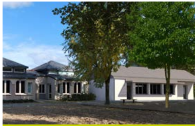
Esquisse projet d'extension de l'école élémentaire

Le trottoir rue du Champ de Foire va être repris en enrobé courant septembre afin d'améliorer son usage.