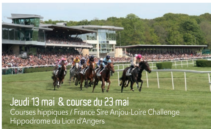
Jeudi 13 mai & course du 23 mai Courses hippiques / France Sire Anjou-Loire Challenge Hippodrome du Lion d'Angers