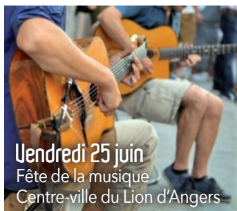
Vendredi 25 juin Fête de la musique Centre-ville du Lion d'Angers

Dimanche 20 juin Randonnée pédestre par les Marcheurs Lionnais