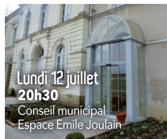
Lundi 12 juillet 20h30 Conseil municipal Espace Emile Joulain

Samedi 26 juin Course hippique Hippodrome du Lion d'Angers