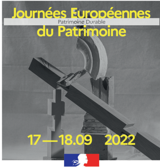
Illustration : © studio Rimasuu